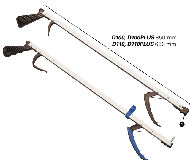
D100, D100PLUS 850 mm D110, D110PLUS 650 mm