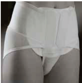
COR: Branco SANITIZED COLOR: Blanco SANITIZED