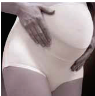
COR: Branco COLOR: Blanco