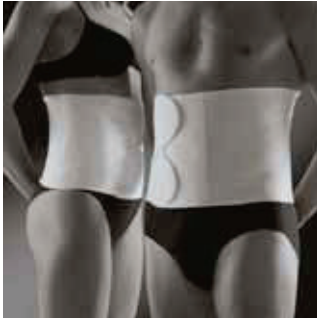
COR: Branco COLOR: Blanco