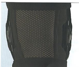
parte de trás (material de rede)