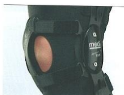
contraforte de estabilização