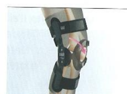
correcção do deslize da rótula